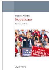
POPULISMO Manuel Anselmi Mondadori, 2017, 9 euro