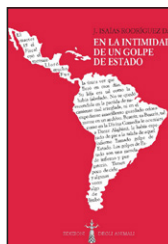
EN LA INTIMIDAD DE UN GOLPE DE ESTADO Isaias Rodriguez Edizioni degli animali, 2017, 15 euro

e su quello delle risorse, finalizzando l'uso al bene comune e non al profitto: «Cambiare il sistema e non il clima», è stato lo slogan di Chávez fin dalla conferenza di Copenaghen sul clima, nel 2009.